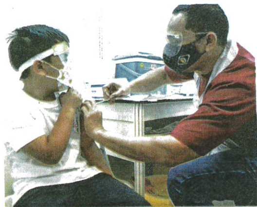
PEMBERIAN vaksin Covid-19 kepada kanak-kanak dalam kalangan usia lima hingga 11 tahun masih rendah.

kesan AEFI. Justeru ibu bapa jangan risau. Kebanyakan AEFI adalah ringan, demam sedikit, bengkak di tempat suntikan sikit," katanya di sini semalam.