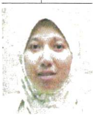
Pensyarah Perubatan dan Pakar Kesihatan Awam, Jabatan Kesihatan Komuniti, Fakulti Perubatan dan Sains Kesihatan, Universiti Putra Malaysia (UPM)

• Projek rintis di Putrajaya boleh diuji dan dinilai keberkesannya sebelum dilaksanakan pada peringkat nasional