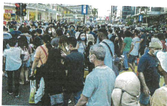
People in masks visiting Bukit Bintang in Kuala Lumpur last month.

The portal also reported 4,949 individuals had recovered from the virus on Friday, bringing the total number of recoveries in Malaysia to 4,618,625.